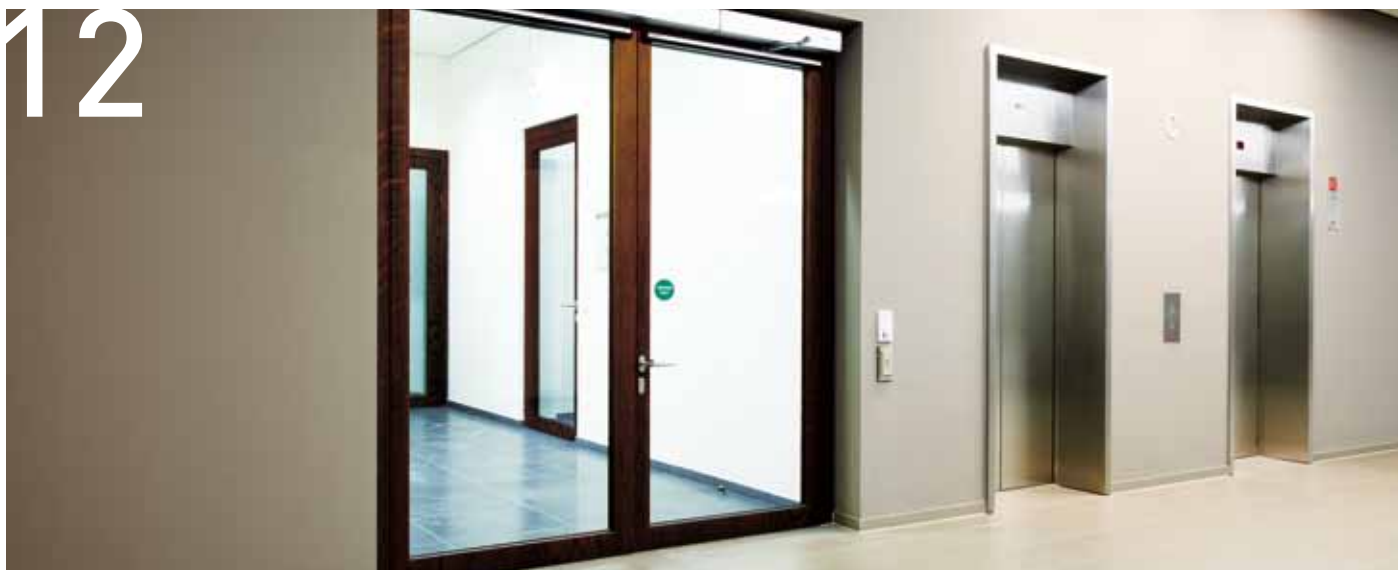
Soluciones de cortafuegos, seguridad y accesibilidad