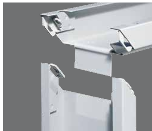
Marco para mampostería