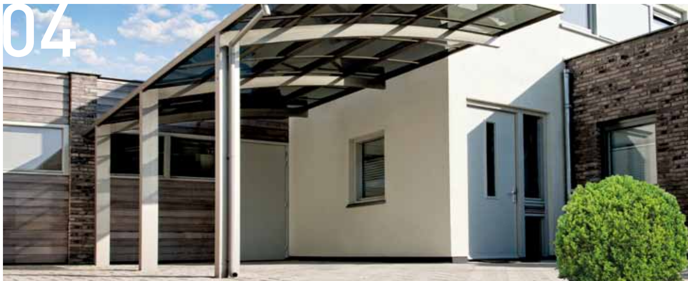
Construcción de viviendas